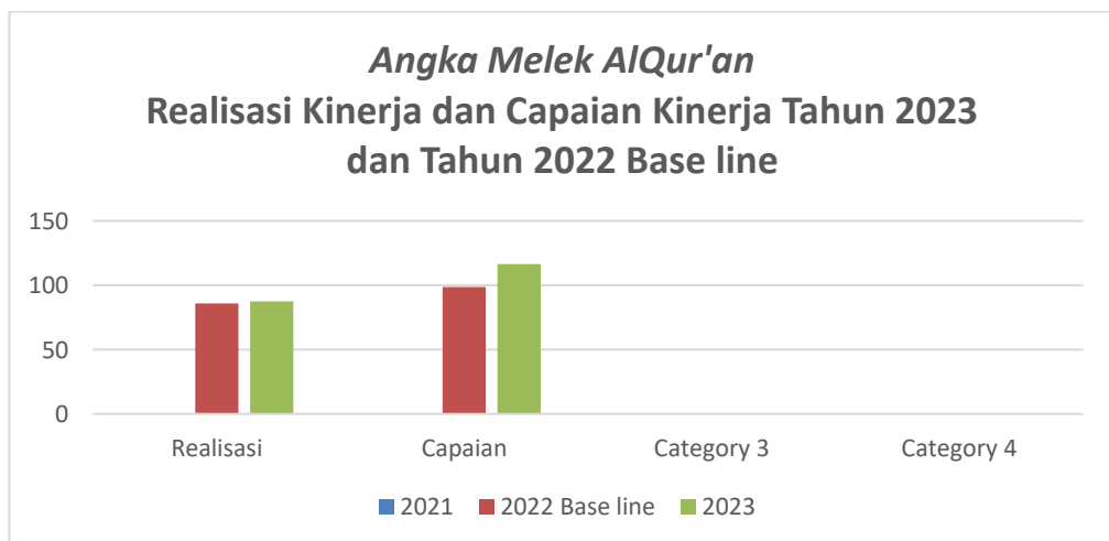
Grafik Angka Melek Al quran

Dalam Pengukuran Capaian sasaran meningkatnya kualitas dan kuantitas memahami Al quran dalam kehidupan masyarakat Dinas Syariat Islam Kabupaten Aceh Jaya secara terus menerus berupaya meningkatkan kinerjanya melalui kegiatan-kegiatan rutin diantaranya :